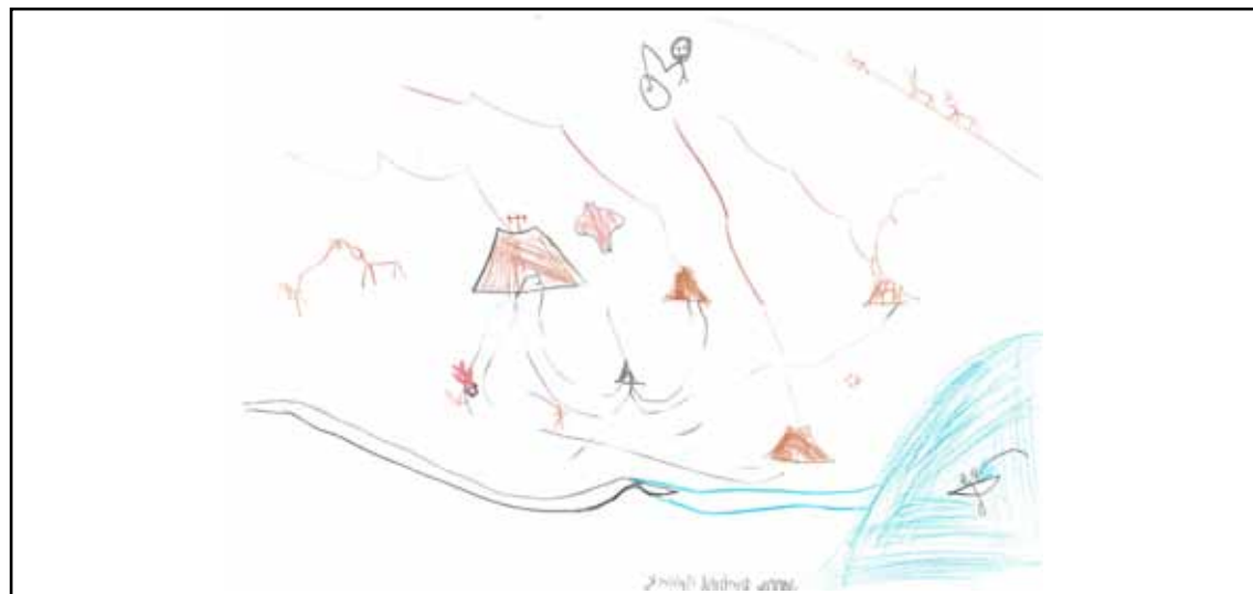
Tegnet av 1-3 klasse ved Åarjel-saemiej skuvle