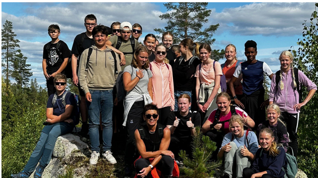
Konfirmantene på pilegrimsturen fra Haldammen til Gravberget.