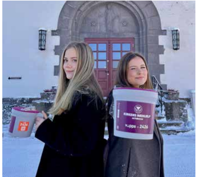
Årets konfirmantkull er klar til innsats!