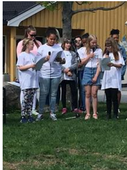
BARNE- OG UNGDOMSKORET DELTOK PÅ GØY PÅ LANDET