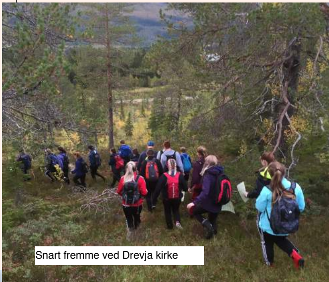
Snart fremme ved Drevja kirke

I Dolstad har vi dette året 110 konfirmanter, og i Drevja og Elsfjord 24. Det er et stort elevkull, så dette gjør at vi har et av de største konfirmantkullene på mange år. Så langt har vi hatt mange hyggelige treffpunkt, og konfirmantene er å se på gudstjenestene i både Dolstad, Drevja og Elsfjord.