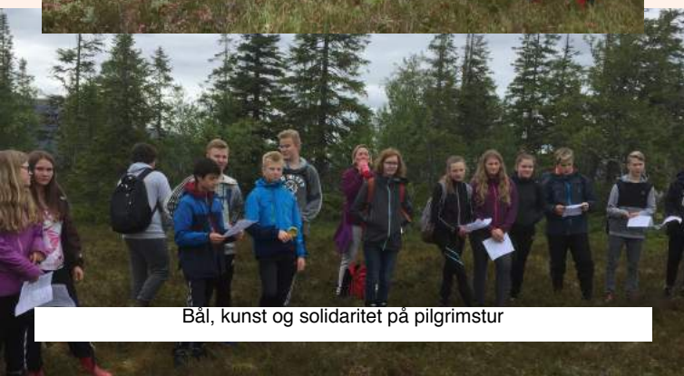
Bål, kunst og solidaritet på pilgrimstur