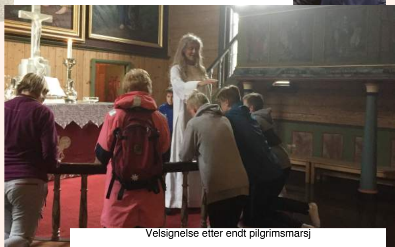
Velsignelse etter endt pilgrimsmarsj