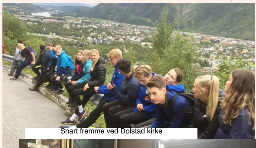
Snart fremme ved Dolstad kirke