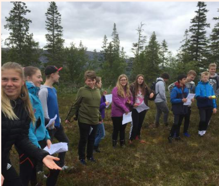
Fra årets pilgrimsmarsj