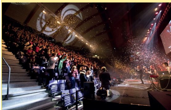
Slik ser det ut når over 1000 ungdommer er samlet på leir.

og tjene som Ham. De har flere leirer i løpet av året, blant annet i Kragerø, hvor vi også skal dra med en gjeng konfirmanter til sommeren!