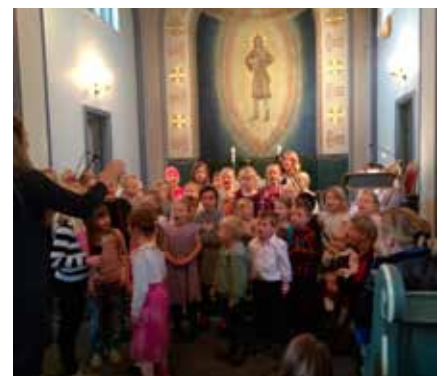
Barnekolet i aksjon

Velkommen til en god førjulssamling i Furuset kirke!