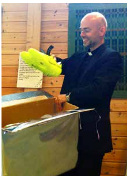
Fotballsko var også en del av gavedryset