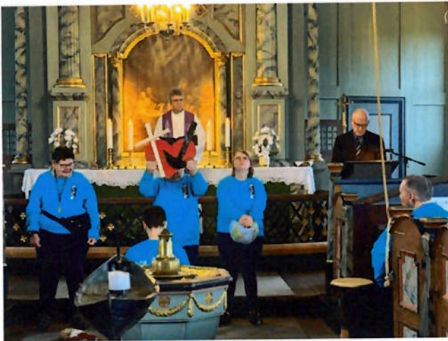
Kor Artig sine medlemmer leder festmenigheten i Klæbu i forbønn

Det var to kirker i byen som for første gang fikk besøk av Kor Artig. I den forbindelse er det planleggings- og refleksjonsarbeid med kirkelige ansatte da det ofte også trengs tilrettelegging.