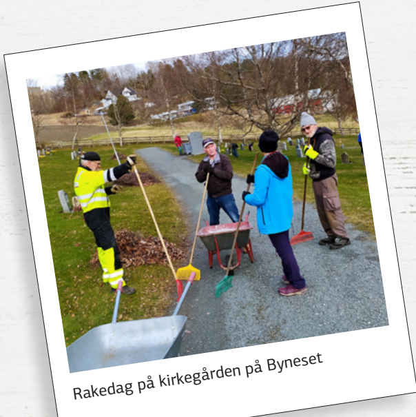
Rakedag på kirkegården på Byneset