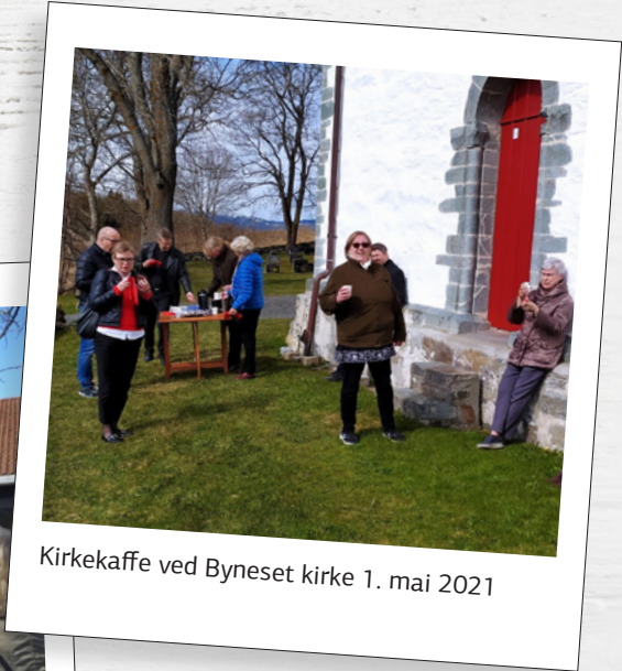
Kirkekaffe ved Byneset kirke 1. mai 2021