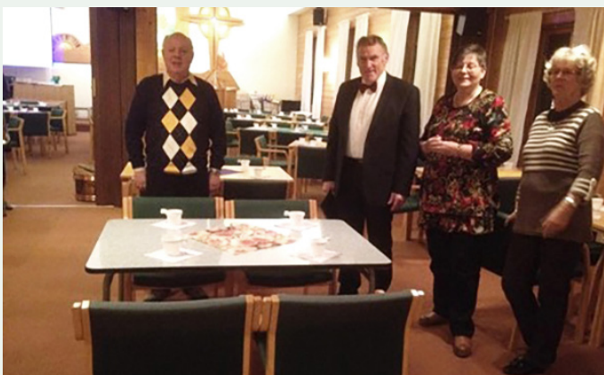
Klart for Estlandskveld/ basar på Berg Bedehus, 2015

I tillegg til de pengene som vi har sendt er det kjøpt inn mye varer til et suppekjøkken der opptil 60 mennesker fikk mat hver uke. Vi har også bidratt med mye til vedlikehold av nåværende kirke, blant annet Trønderrødt til utvendig maling av hele kirka. Presten har også fått presteklær.