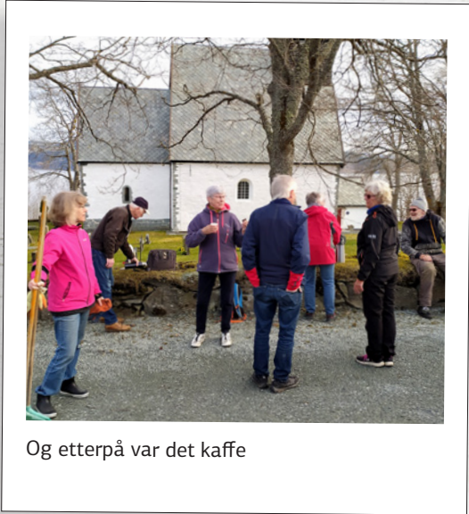
Og etterpå var det kaffe