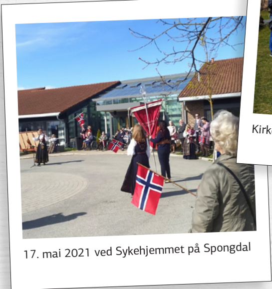
17. mai 2021 ved Sykehjemmet på Spongdal