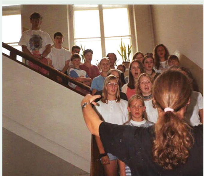
Ungdomskoret synger på Tõrva Sykehus, 1994

Estland er det minste og det nordligste landet av de tre republikkene som utgjør Baltikum. Det grenser mot Østersjøen i nord og vest, mot Latvia i sør og Russland i øst. Estland består av en flat halvøy, og i Østersjøen finner man de to store øyene Saaremaa og Hiiumaa. Grensen mot Russland domineres av innsjøen Peipsi. Befolkningsmengden var på ca 1,3 millioner i 2019.