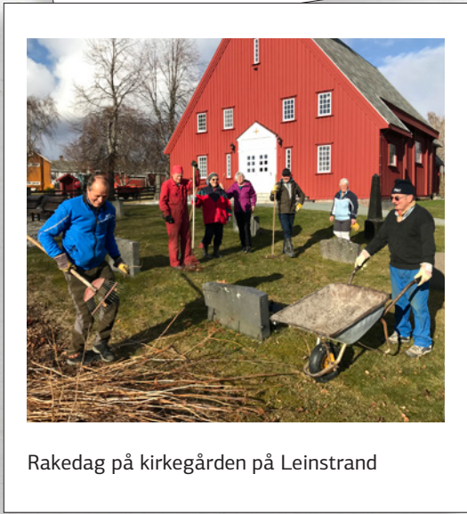
Rakedag på kirkegården på Leinstrand