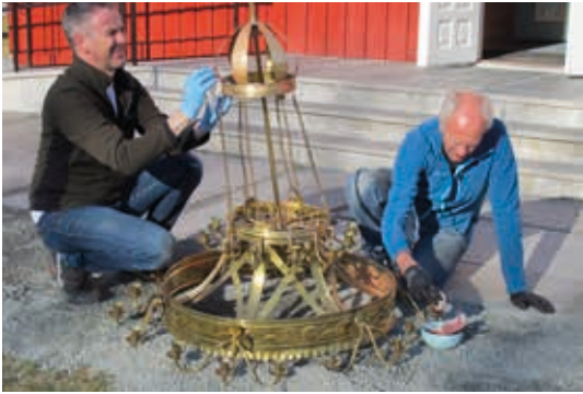
No blir lysekrona i Leinstrand kirke blank og fin...