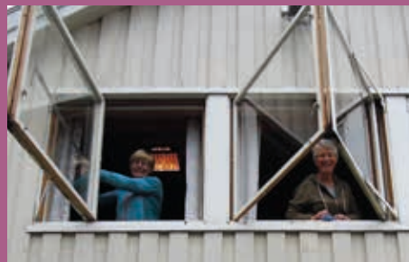
Årets dugnad på Berg bedehus. Vasking, rydding og jobbing med uteområdet. Da er det trivelig med felles lunsj!