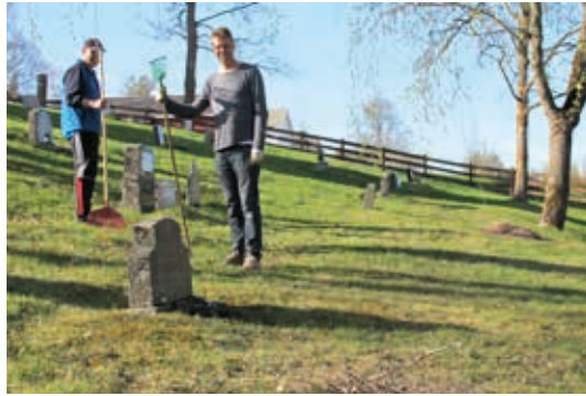
...og kirkegården blir ryddig.