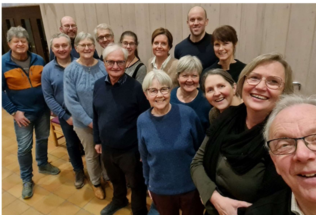
Det nye menighetsrådet i Byåsen 2023 – 2027