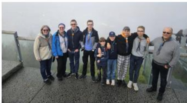
Figur 1: Fløybanen 2025