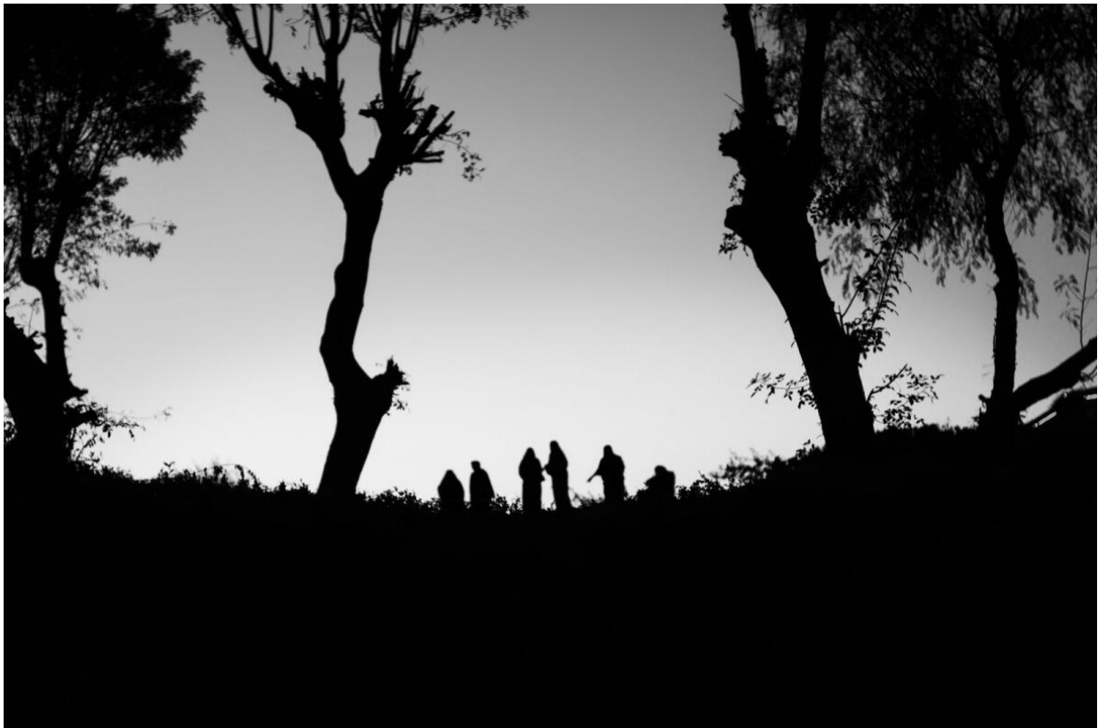
Dette bildet er tatt i Jerusalem og skal symbolisere Jesus og disiplene i Getsemane.

Han har også fotografert i Israel på steder der Jesus vandret.