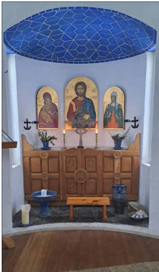
Alteret i Fotinis kapell - dette ortodokse kapellet møter deg midt i skogen på Lia gård.