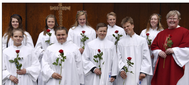
Hedalen stavkirke 4. juni.