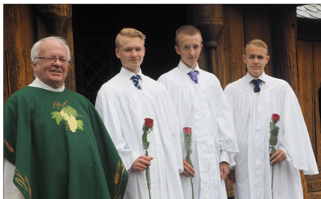
Reinli stavkyrkje 11. juni.