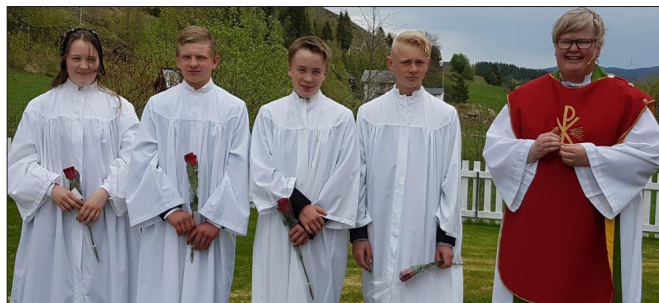
Leirskogen kyrkje 28. mai.