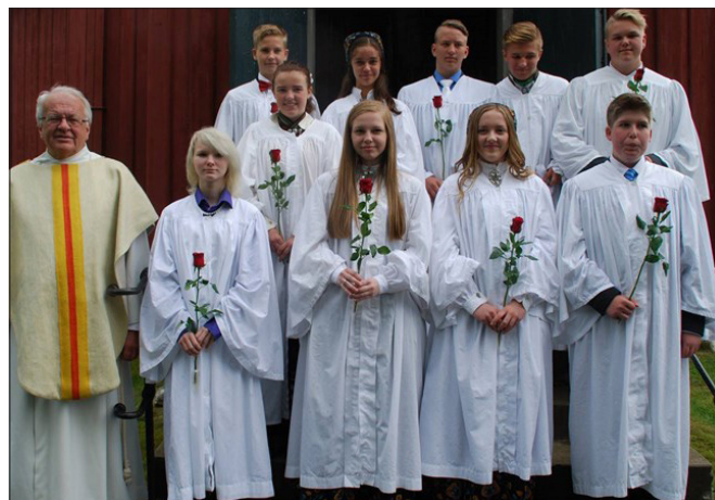
Bagn kyrkje 4. juni.