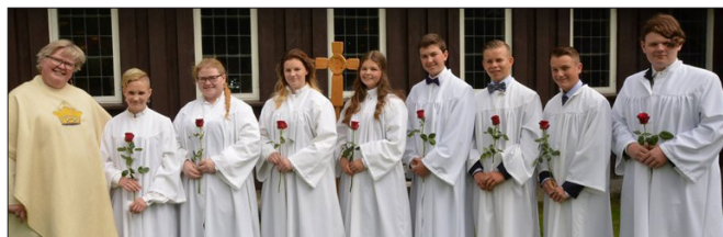
Begnadalen kirke 11. juni.