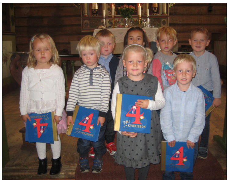
Fra utdeling av 4 årsbok i Bagn kyrkje 3. september.