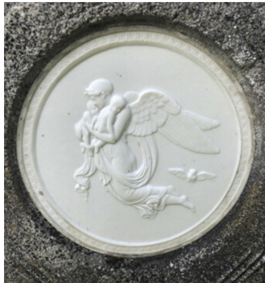
Natten. Fremstilt billedmessig av Bertel Thorvaldsen.