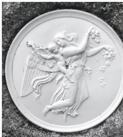
Dagen. Også fremstilt av Bertel Thorvaldsen.