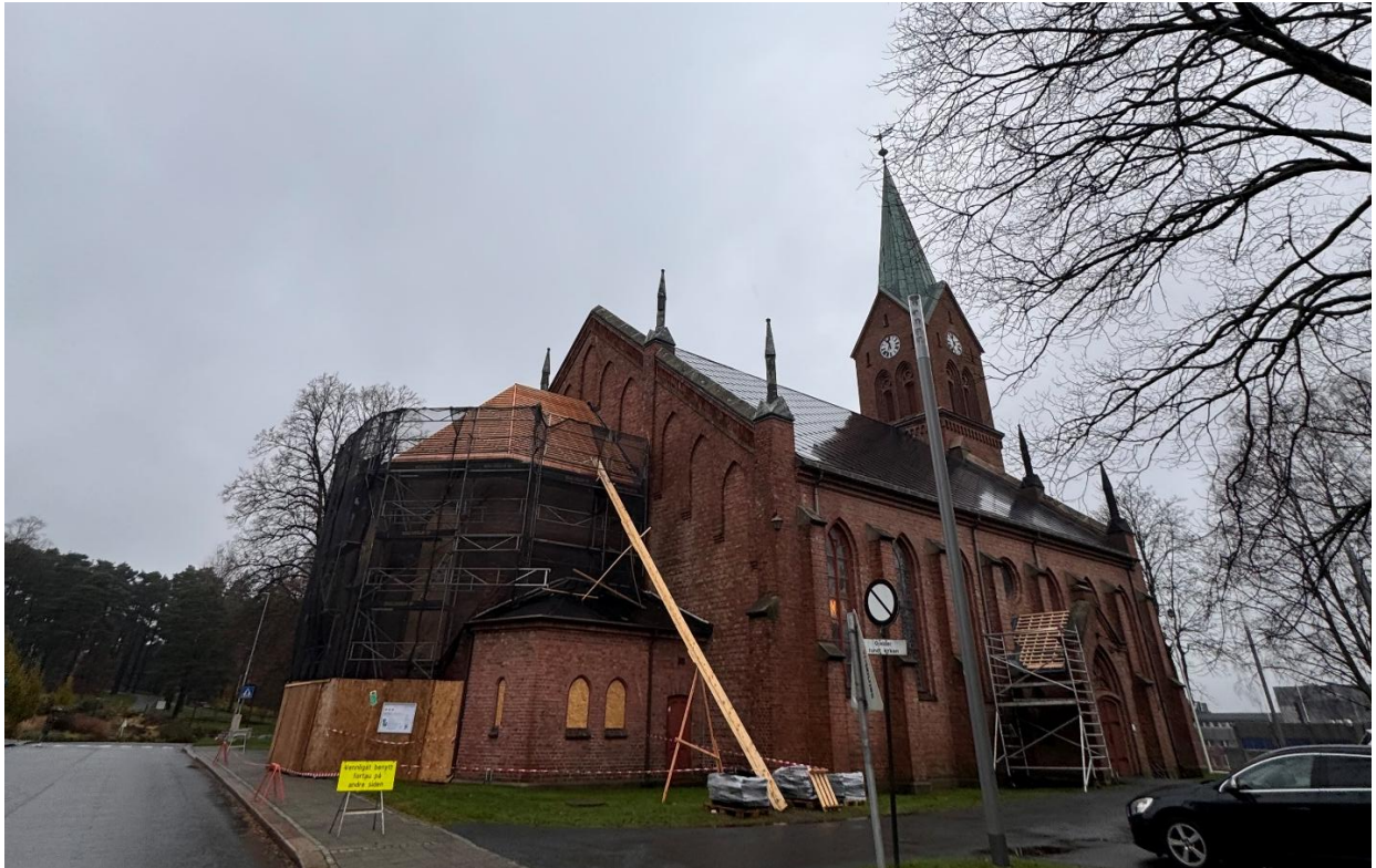
Figur 2: Rehabilitering av kor, sakristier og sideinnganger