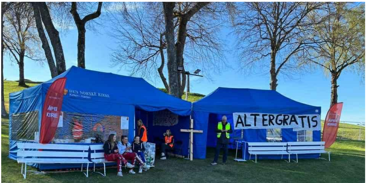
Figur 17: Sarpsborg kirke ved russtreff på Fredriksten festning