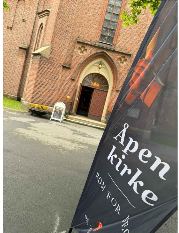
Figur 12: Åpen kirke 2025