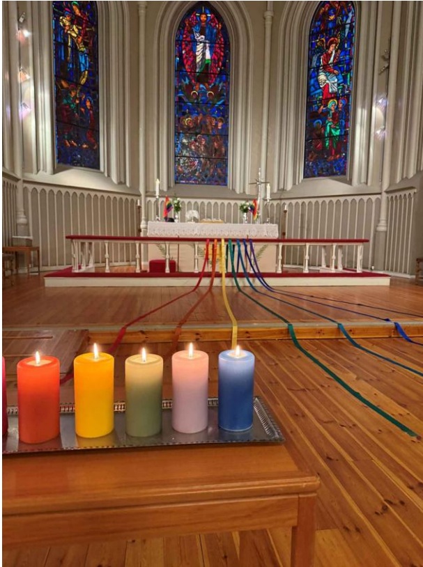
Figur 10: Pride-messe 2025