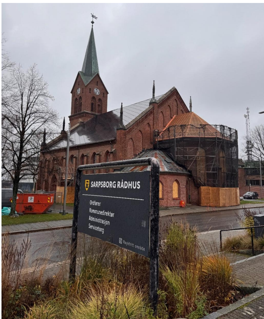
Figur 1: Rehabilitering av kor og sakristier

I høst og vinter 2025-2026 ble det utført vedlikehold på Sarpsborg kirke. Tak over kor, sakristier og sideinnganger ble rehabilitert.