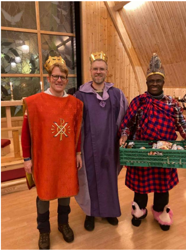
Figur 4: Juletrefest 2025 - de hellige 3 "konger"