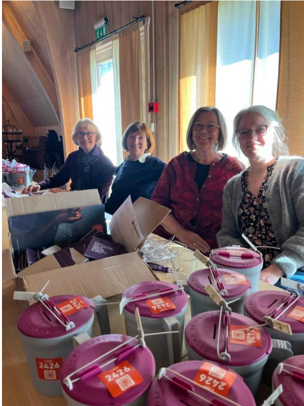
Figur 8: Fasteaksjonen 2025 - bøsseaksjonen