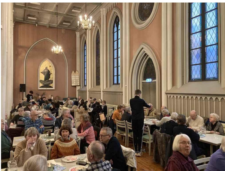
Figur 15: Kirkemiddag 2025