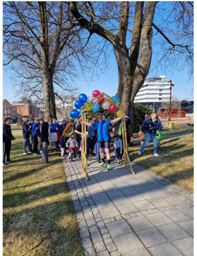
Figur 7: Fasteaksjonen 2025 – Sponsorløp