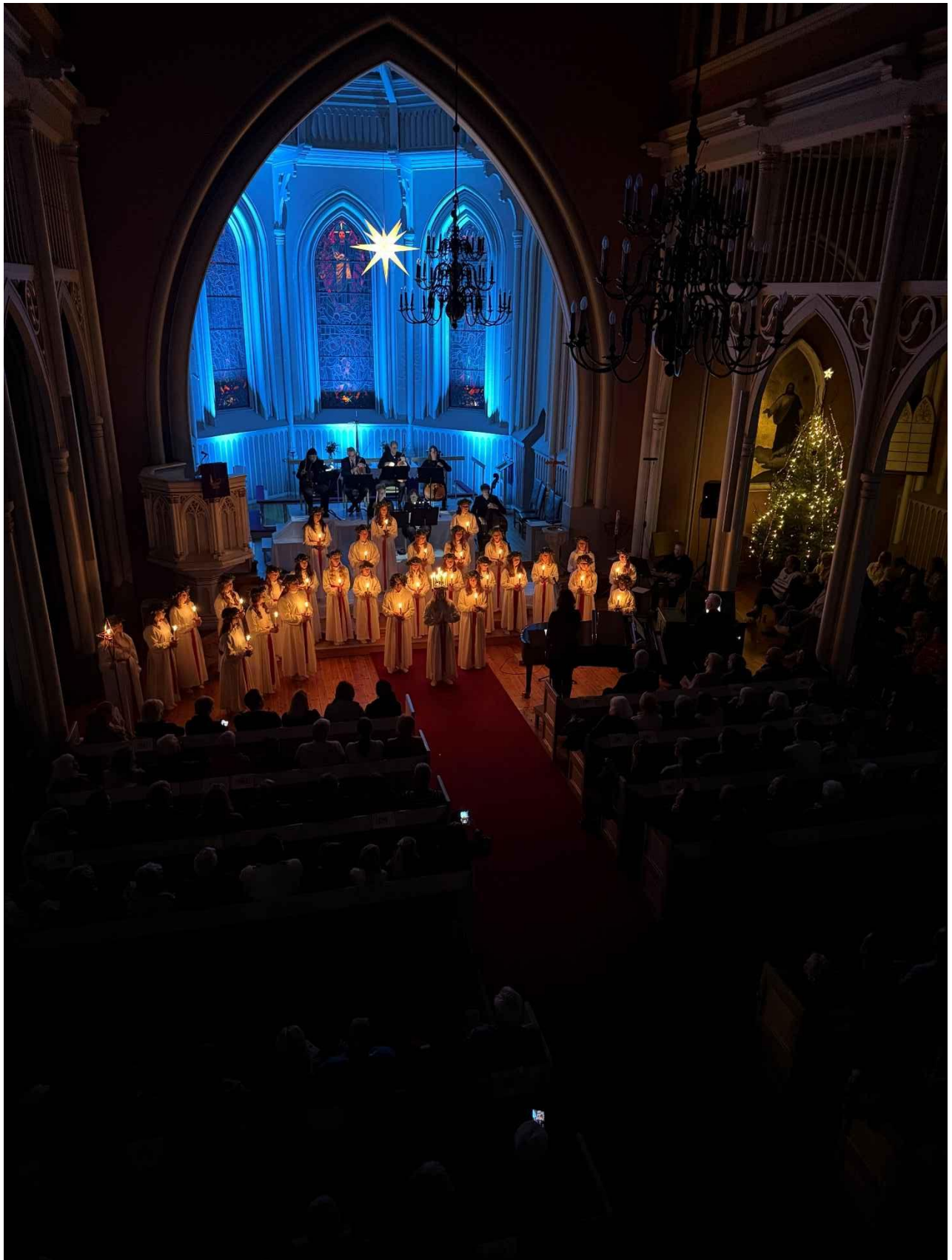
Figur 18: Luciamorgen 2025