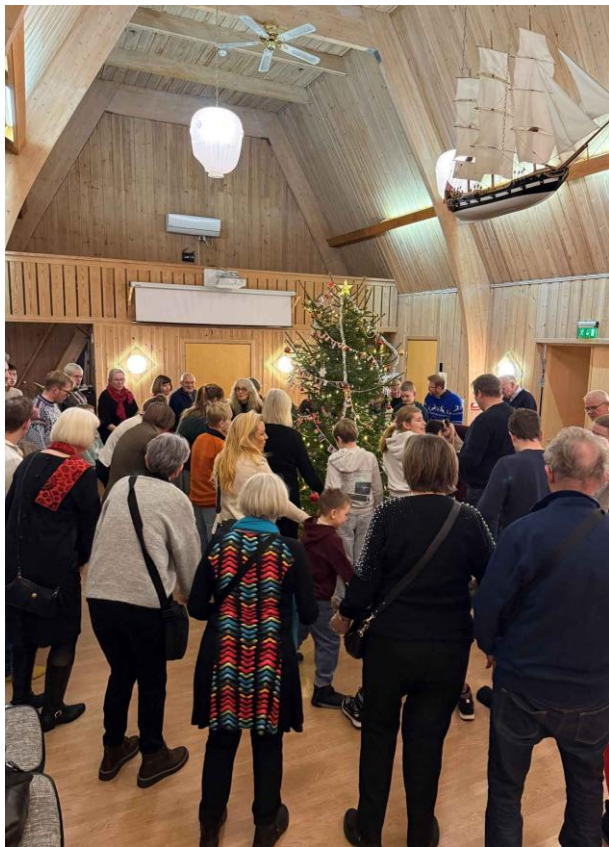
Figur 5: Juletrefest 2025