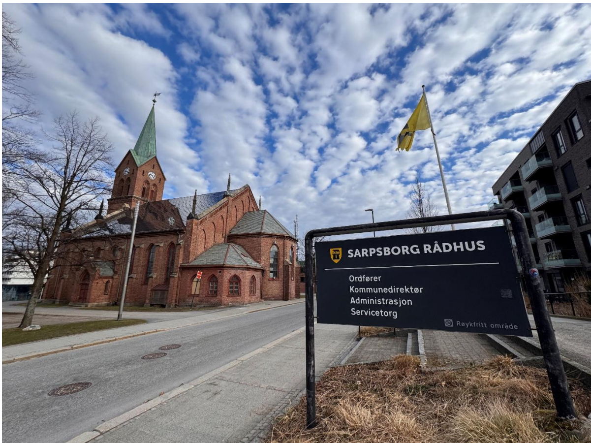
Figur 3: Sarpsborg kirke etter rehabiliteringsarbeidene