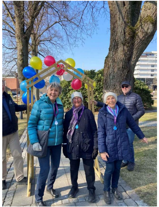
Figur 6: Fasteaksjonen 2025 – Sponsorløp