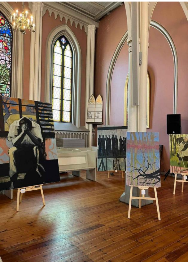
Figur 11: Sommerutstilling 2025