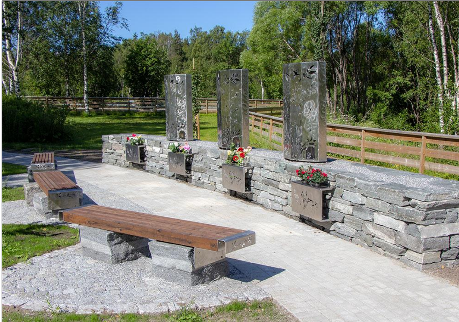
Mo i Rana