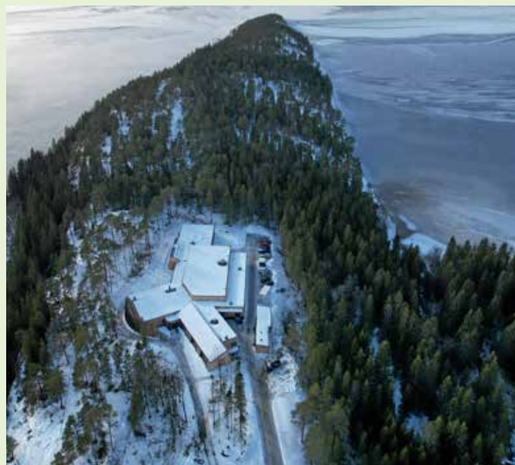
Nybygget ligger flott til på Horjemstangen, like ved innkjøringen fra E6 ved Snåsa.