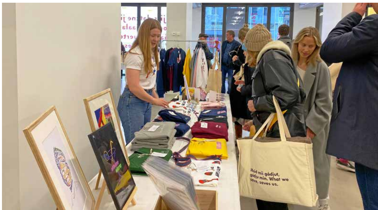
Sijhth maam ástedh?