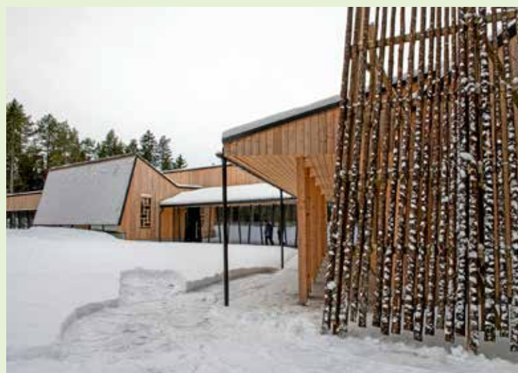
Når sommeren er her, er det enda finere å samles utenfor museumskafeen.