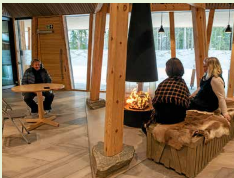
Saemien Sijte har fått lyse og innbydende lokaler.