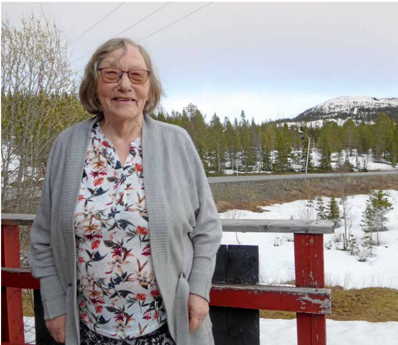
Hun bor sentralt, like ved E6 på Majavatn og har gjerne et godt smil når du møter henne.