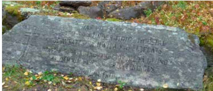
Gamla kyrknäset vid Tärnaby är en av platserna repatriering har utförts.