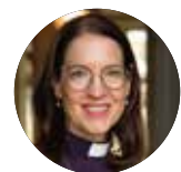
Teresia Boström, biskop i Svenska kyrkan, Härnösands stift

Min sang den bærer min sjel, mot himmelen den løfter seg, og min sang den gir jeg til deg, du som skaper alt med kjærlighet. (Saalmegærja 6:4)