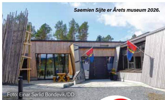
Saemien Sijte er Årets museum 2026.