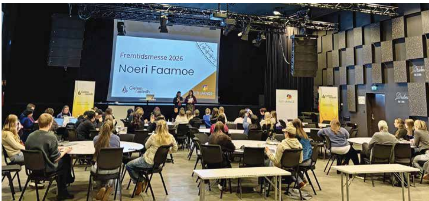
Tjåanghkoen Noeri faamoe njoktjen gaskoeh Návmesjenjaelmesne öörnesovvi.