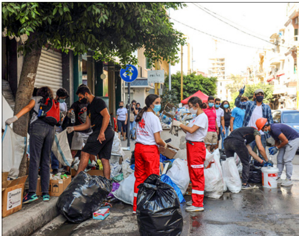
Ungdommer rydder gater i Beirut.

– Jeg hadde aldri sett noe lignende før. Etter at vi var ferdige med å filme rundt havnen, gikk vi til Gemmayzeh, hvor mine foreldres butikk ligger. Vi ville se hva som skjedde