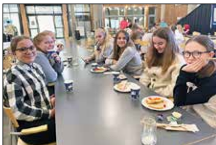
Tekst og bilder: Kristin H. Bekkevold