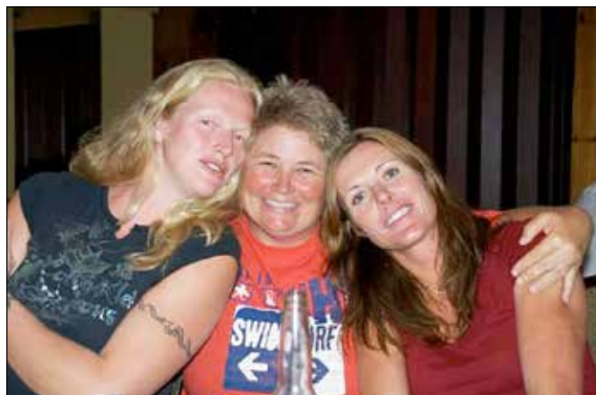
Meg og to gode venninner i USA.