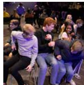
Liv og lyst på Enter i kirkekjelleren

Takk til dere som trofast betaler – gjennom pandemi, ferier og annet som forstyrrer den faste rytmen! Noen har vært med i mange år. (Regn på det: Hvor mye blir 500 kr måneden i 20 år?) Dette er midler for å skape gode betingelser for fellesskap – gode lokaler med godt utstyr og ikke minst flere gode ledere. Nå går det mot sommerferie. Men i det lades opp til en høst med ekstra innsats. Da er det er bruk for deg. Du inviteres til å delta - til å gi. Gi av din tid, din kompetanse eller dine midler! Det er bruk for deg!