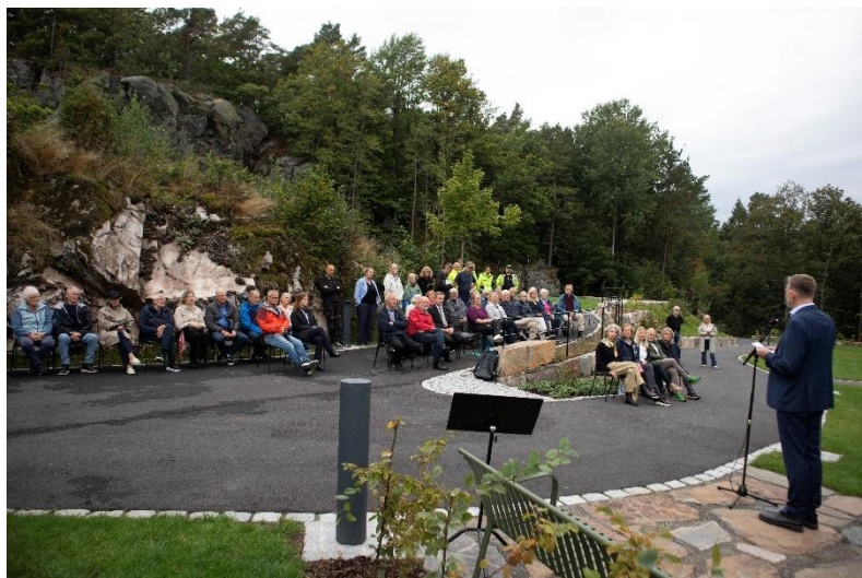
Den nye gravplassen ved Randesund kirke ble innviet 3. september 2025

Det er gjennomført ordinær oppfølging av elektro- og brannsikkerhet, i tillegg til de rutiner som følges av fellesrådets vedlikeholdsteam, herunder utvendig maling og generelt tilsyn av bygget. «Den yngre kirkeringen» med venner gjennomførte en større dugnad i kirken i begynnelsen av desember. Kirkesølvet ble pusset, støv fjernet og kirkerommet støvsugd, slik at kirkerommet var godt forberedt til julehøytiden. Renholdet av kirken gjøres delvis av kirketjener og delvis av firma.