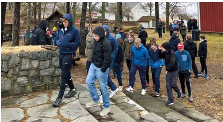
Fasteaksjonen, konfirmentenes sponsorløp.