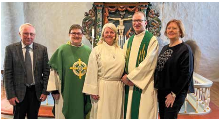
Innsettelse av ny kappelan.