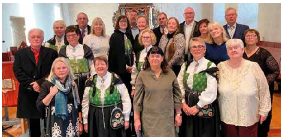
50 års konfirmanter.