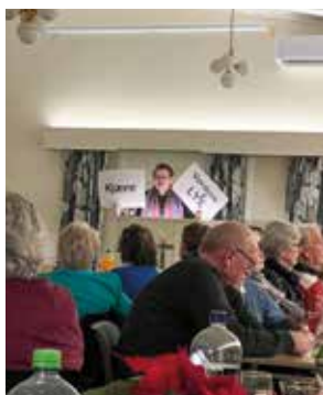
Fest for de frivillige.