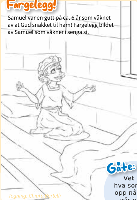
Tegning: Chiara Bertelli

Samuel var en gutt på ca. 6 år som våknet av at Gud snakket til ham! Fargelegg bildet av Samuel som våkner i senga si.