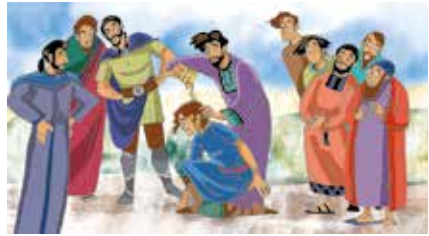
Tegning: Kari Sortland

Samuel hørte mange ting fra Gud. Da Samuel ble voksen fortalte Gud ham hvem som skulle bli konge. Kan du finne fem feil på bildet under?