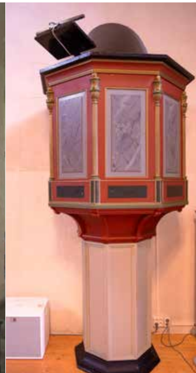
Preikestolen i Hoff frå 1829.