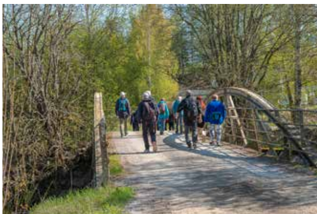
Vi passerer Lenaelva på brua ved Galgerud.