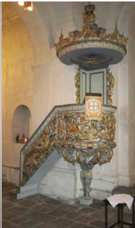
Preikestolen i Ringsak-kjorkja var forbildet for stolen i Hoff.