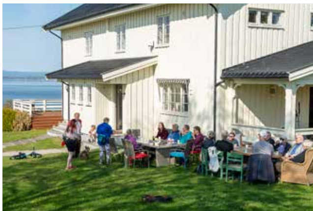
Vandrarane koste seg med kaffe og kaker i godveret før dei la ut på siste delen av vandringa, nedom Mjøsstranda og oppatt til kjørkja i Totenvika.