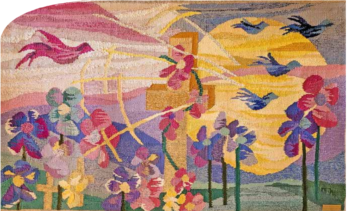
Bildeveven er en gave fra Saniteten til kirkestua på Kapp.