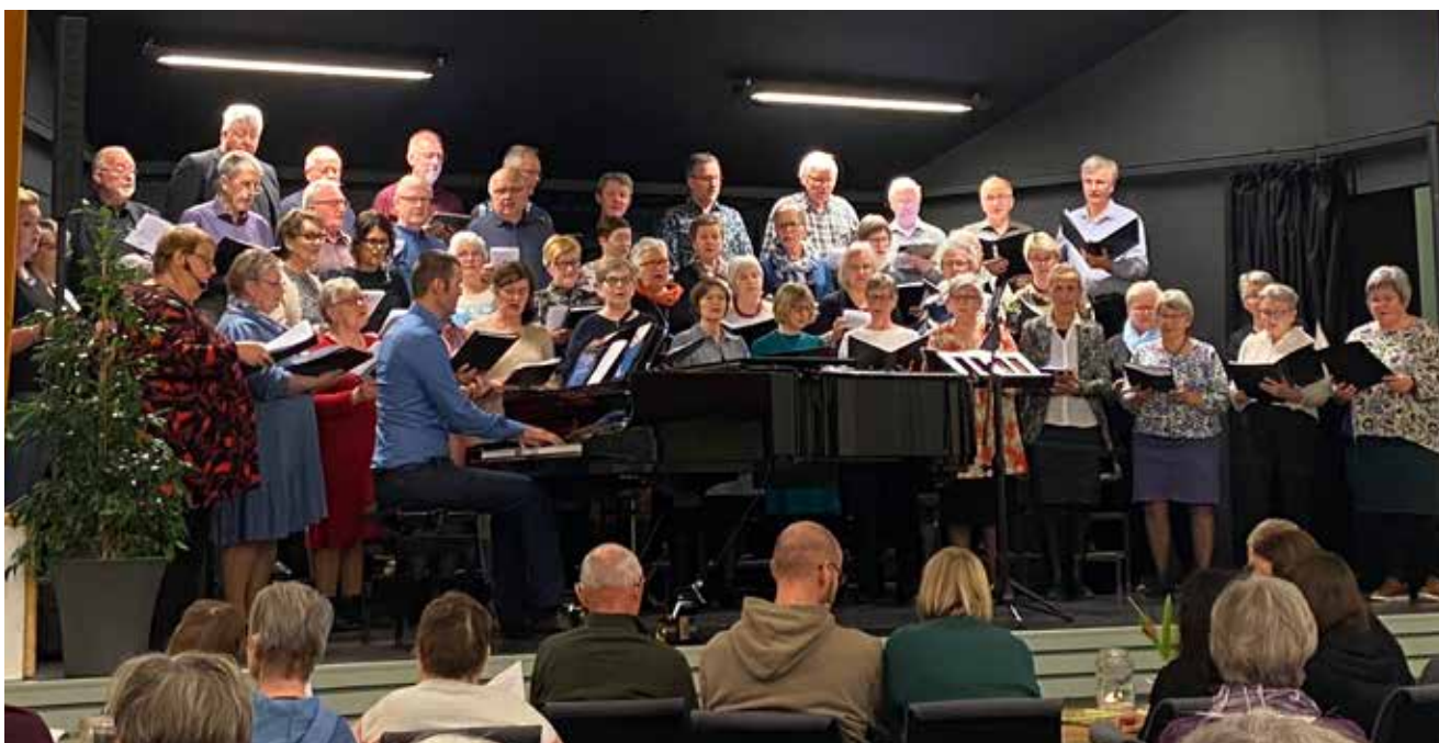
Vakker korsang av Hoff korforening på kaffekonsert.