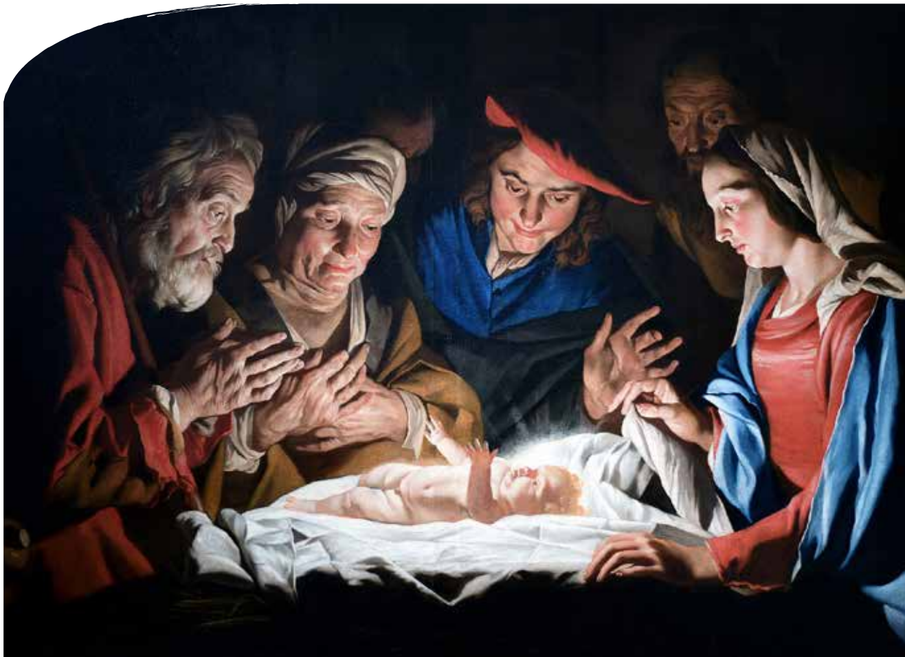
Jesu fødsel malt av Matthias Stomer, 1632.