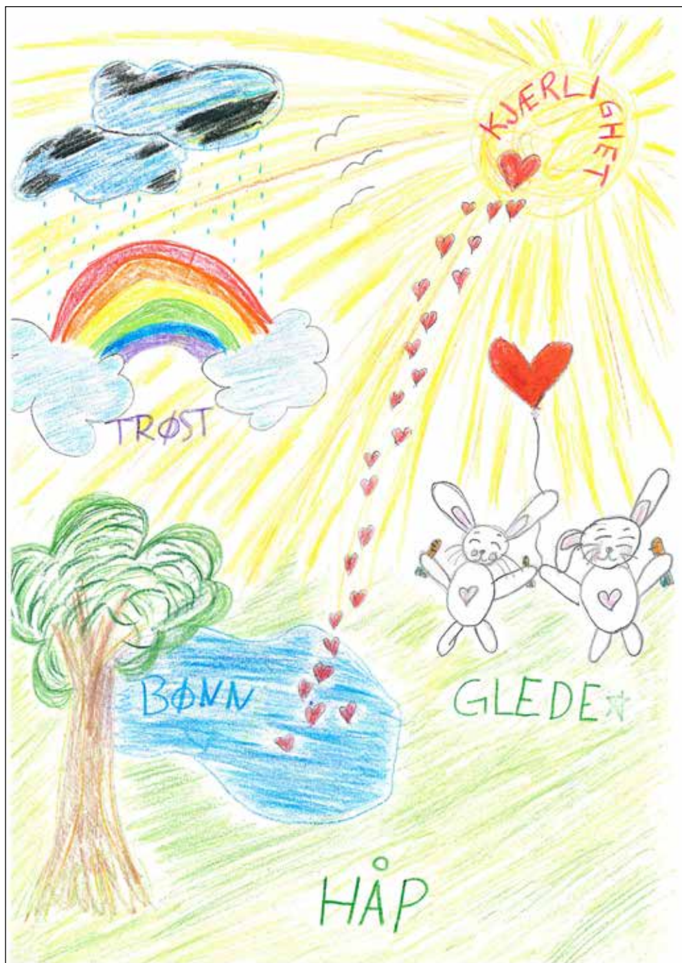
Tegning av Alvilde Arntzen Gulli