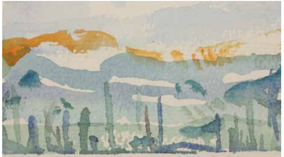
Illustrasjon: Gjertrud Marie Farnes

Velkommen til «Stille dag – en smak av retreat» i Tonsen kirke lørdag 15. oktober kl. 10:00-15:00.