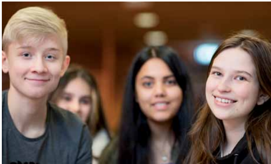
Velkommen som konfirmant i Tonsen kirke.

Alle kan bli med i konfirmasjonstiden i Tonsen! Det viktigste er at du er nysgjerrig på livet og vil vite mer om kristen tro, og hva den kan bety for deg.