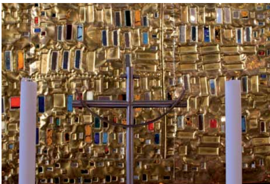
Lilleborg kirkes vakre altertavle – det nye Jerusalem.

Også en rekke andre tiltak vil NMS legge til Lilleborg kirke, møter og fester, julemesse, konferanser, misjonsstevne, årsmøter, regionale tiltak,