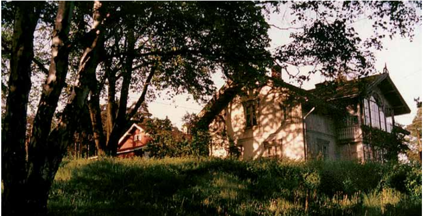
Åsly gård i 1983. Anlegget er regulert til bevaring. Dagens eiere har tatt godt vare på det gamle huset og uthusene.

Øverst i den bratte bakken fra Lunden bussholdeplass på Trondheimsveien opp til Tonsenhagen ligger det et gammelt gårdsanlegg med et staselig sveitserhus. Det er Åsly gård. Denne artikkelen handler om dem som bodde der tidligere og gartneriet de drev.