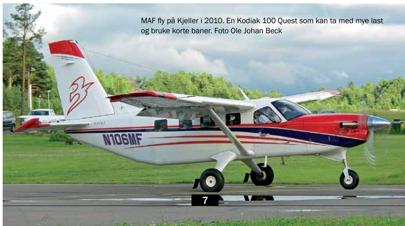
MAF fly på Kjeller i 2010. En Kodiak 100 Quest som kan ta med mye last og bruke korte baner.

Engasjementet som vikarprest i Tonsen nå i vinter fikk han av prosten i Groruddalen. Ole Johan sier det var hyggelig å kunne bidra. – Selv om det har vært mye hjemmekontor og lite gudstjenester, har det likevel vært muligheter for å møte mennesker til samtale i kirken i forbindelse med begravelser. Det var spesielt fint å kunne holde kirkerommet åpent noen timer på julaften for dem som ville stikke innom og tenne lys og ha en stille stund. Det er godt å være tilbake i Tonsen. Jeg har mange minner herfra. Jeg kjenner at det å være i Tonsen er blitt en viktig del av min identitet.