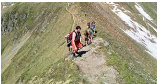
Bilde fra sommertur 2019 i Østerrike, tatt på 2400 meters høyde i nærheten av Innsbruck

For mer informasjon, se nettsidene: http://7oslo.no eller https://www.facebook.com/7oslo