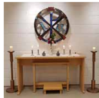
Alteret i kirkerommet Økern sykehjem.