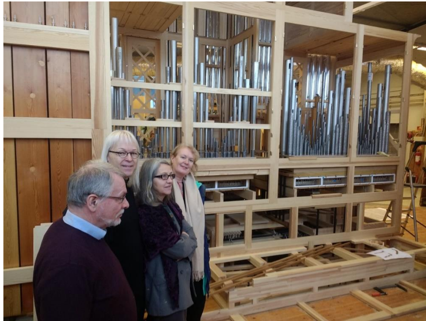
Orgelkomite med flere på ekskursjon til Ryde og Berg februar 2019

Det er en fin indre dynamikk i komiteen, med stor iver for orgelsaken, noe som utløser gode og innovative prosesser som i løpet av 5-10 år kan stake ut veien for nytt orgel.