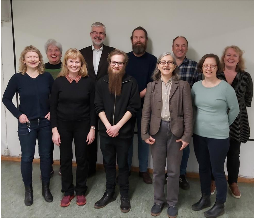
Nytt menighetsråd fra okt. 2019

Nytt menighetsråd ble valgt i september 2019 og startet sin funksjonsperiode 1.11.2019. På konstituerende møte 22.10.2019 ble leder og to nestledere valgt for ett år, og representanter til fellesrådet valgt for fire år.