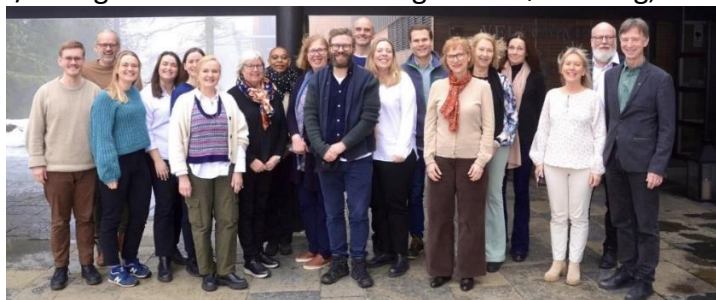
Menighetsrådet og stabsansatte samlet til strategisamling på Soria Moria 2. mars 2023.