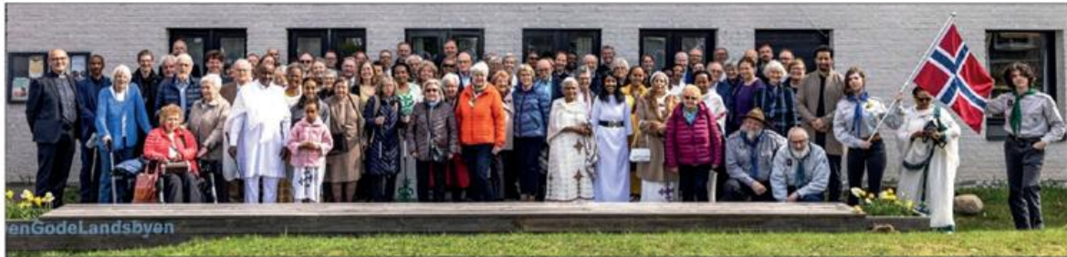
FULLT HUS OG FELLESSKAP: Over hundre mennesker samlet seg utenfor Haugerud kirke i forbindelse med kirkens og menighetens 50-årsjubileum.