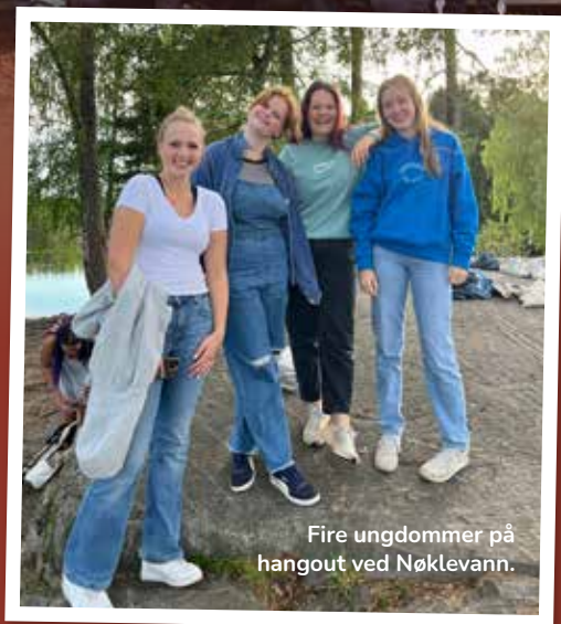
Fire ungdommer på hangout ved Nøklevann.

HANGOUTS: Vi har hatt tre hangouts i kirka denne høsten. Sist hangout var det konfirmasjonsreunion hvor tidligere konfirmanter var ekstra velkommen for å mimre tilbake til konfirmasjonstiden. Denne kvelden hadde vi også en konkurranse kalt «kaosgames», og stemningen var god og høylytt! 11. desember er det julehangout med ungdomsarbeidet i kirka. Det blir en kveld med mye gøy