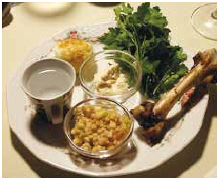
”Seder-fatet” som inneholder deigen av frukt/nøtter, persille, saltvann, kokt egg, lammeknoke, bitre urter – og dessuten usyret brød.

Vi tror skjærtorsdagkvelden feiret på denne måten er en handling som både skaper