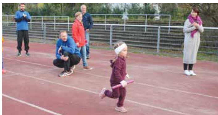
Stafett med ordentlig stafettpinne er også gøy.

år. 309 løpende barn var det i 2014 og hvem vet! Kanskje det blir ny rekord 6.juni 2015 da det 11. løpet går av stabelen på Lambertseter Stadion.