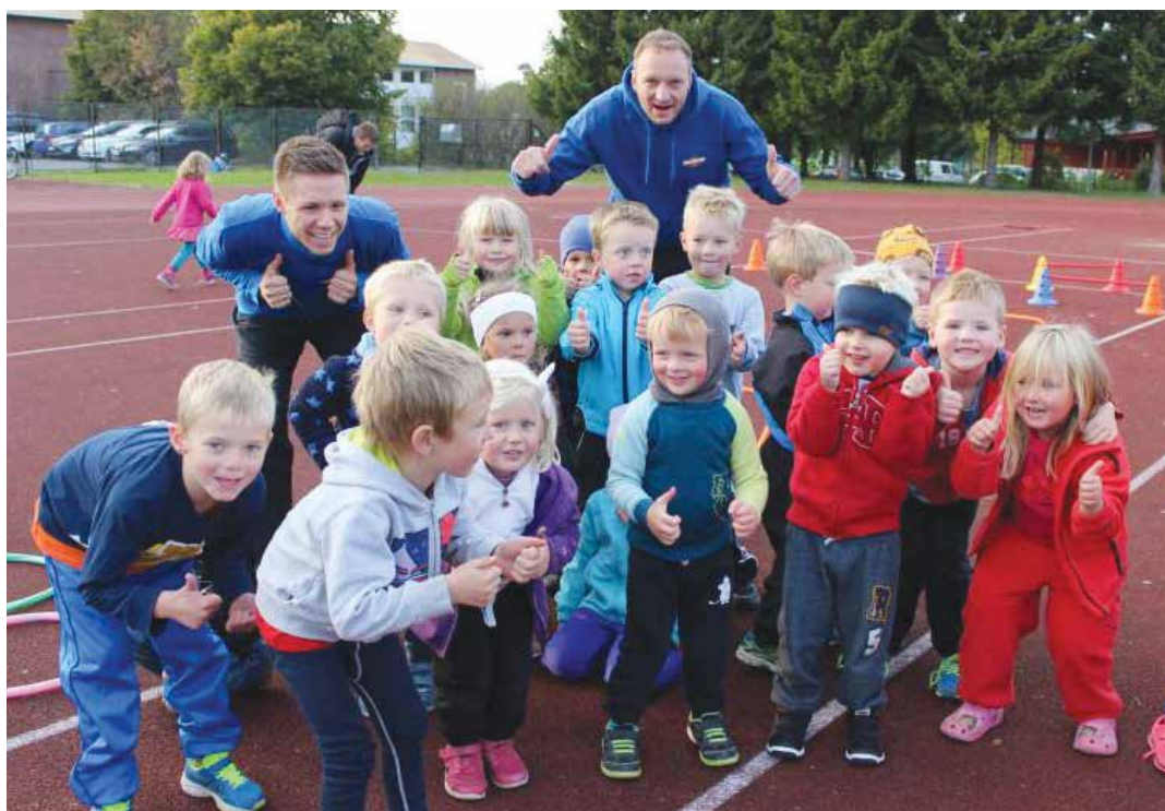
Gøy på trening med «Ta-Tutta-Tei»

Avslutningsvis hver sesong, arrangeres barneløp på Lambertseter Stadion for ALLE barn i alder 4-15 år. Barna løper 1 kilometer rundt i idrettsparken med start og mål på stadion. Medalje til alle! Sist år hadde vi 10-års jubileum med show fra scene. Like stor ståhei er det ikke hvert år men med en voksende tilstrømning setter vi nye deltager rekorder hvert