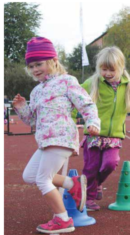
Allidretts trening på Lambertseter Stadion, hinderløype.

Det vi alle ønsker oss nå er en hall. Å få en kommunal hall er en tung materie, men både skoler og idrettsforeninger tilhørende Lambertseter har et skrikende behov. Plassering og nødvendige arkeologiske undersøkelser er gjort, men penge-sekken er ikke stor nok. Prioriteringen fra Oslo