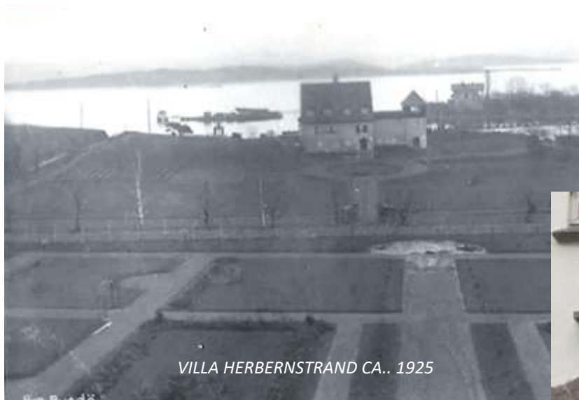
VILLA HERBERNSTRAND CA.. 1925