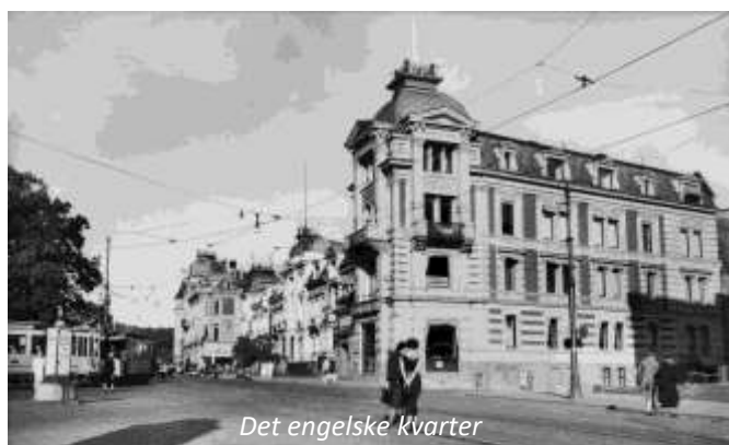
Det engelske kvarter