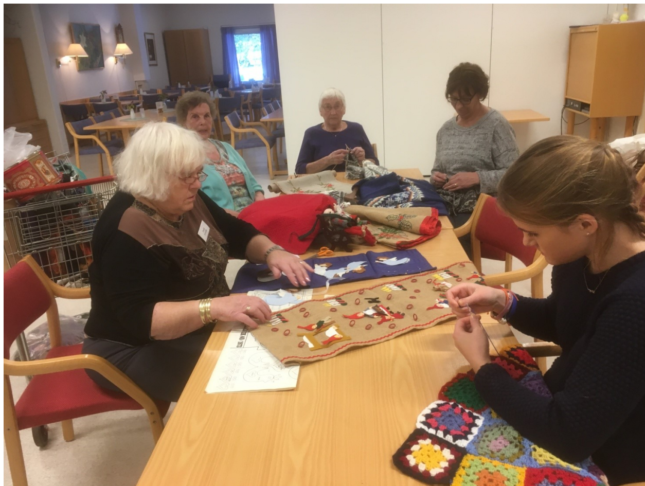
Innspurten til julemarkedet blant noen av håndarbeidsgruppen

Vi har 57 frivillige hjelpere fordelt på samtlige områder av virksomheten. Foruten frivillige til kafeteriaen har vi frivillige som vertinner. De tar imot brukerne og viser nye brukere til rette. Vertinnen tar imot telefoner og påmelding til turer og arrangement. Frivillige leder også grupper, gjør kontorarbeid med IKT og er sjåførere. I tillegg har vi noen dager frivillige som gjør rent på senteret. I mai inviterte vi de frivillige til fest på seniorsenteret og serverte reker og vin. Om høsten hadde vi tur til Fetsund lenser med middag og omvisning i tidligere sagbruk i Gansvik, en svært vellykket tur.