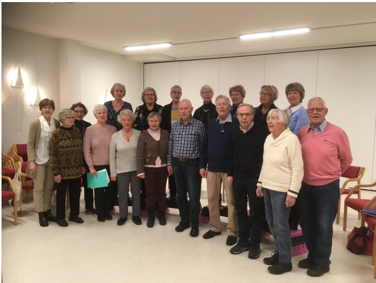
Koret har øvelse hver mandag

Veiledning i bruk av nettbrett og PC gjøres løpende med avtaler med den enkelte.