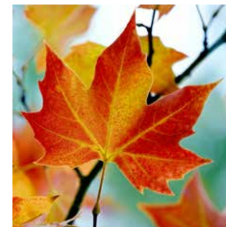
Høsttakkefest i Vestre Aker 11. september og i Bakkehaugen 18. september.