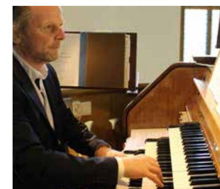
Allehelgensgudstjeneste og orgelresitasjon i Vestre Aker 6. november.