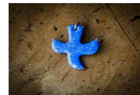
Kveldsmesser med Taizépreg første søndag i måneden i Vestre Aker.