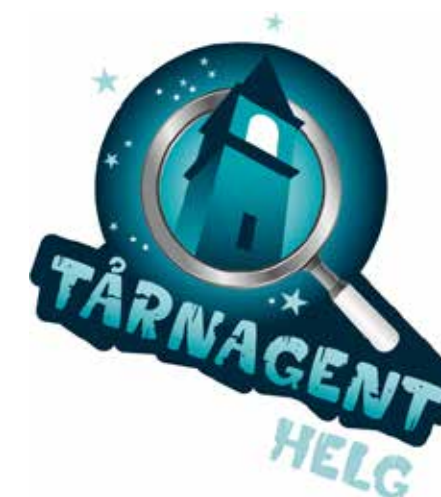
Tårnagenter i Vestre Aker 9. februar.