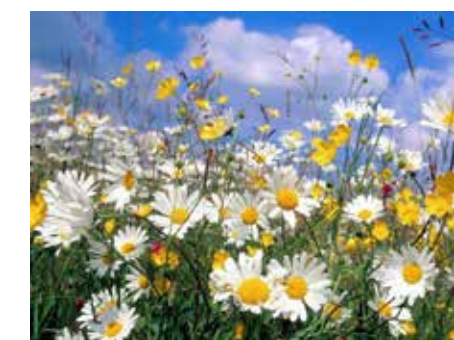
Blomstermesse i Bakkehaugen 14. juni