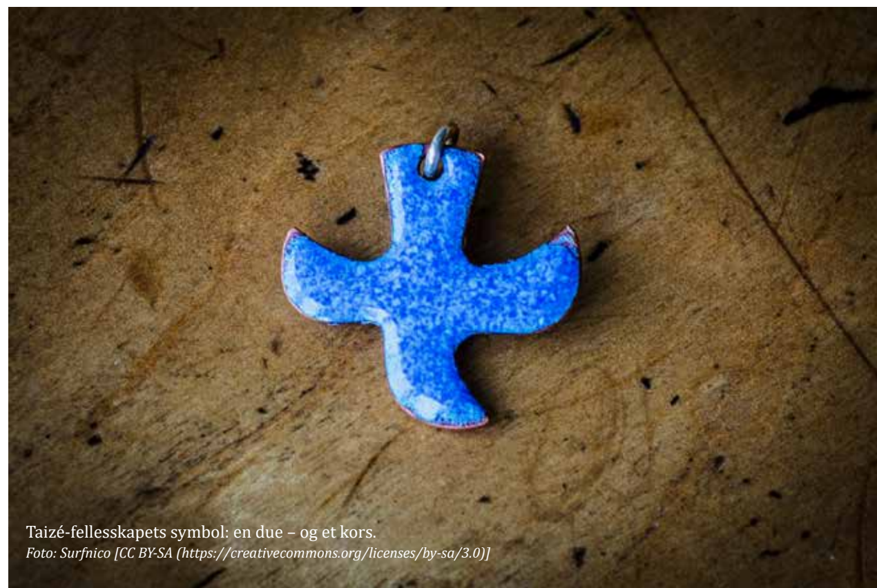
Taizé-fellesskapets symbol: en due – og et kors.

Datoene for vårens kveldsmesser med Taizépreg er 2. februar, 1. mars og 3. mai.