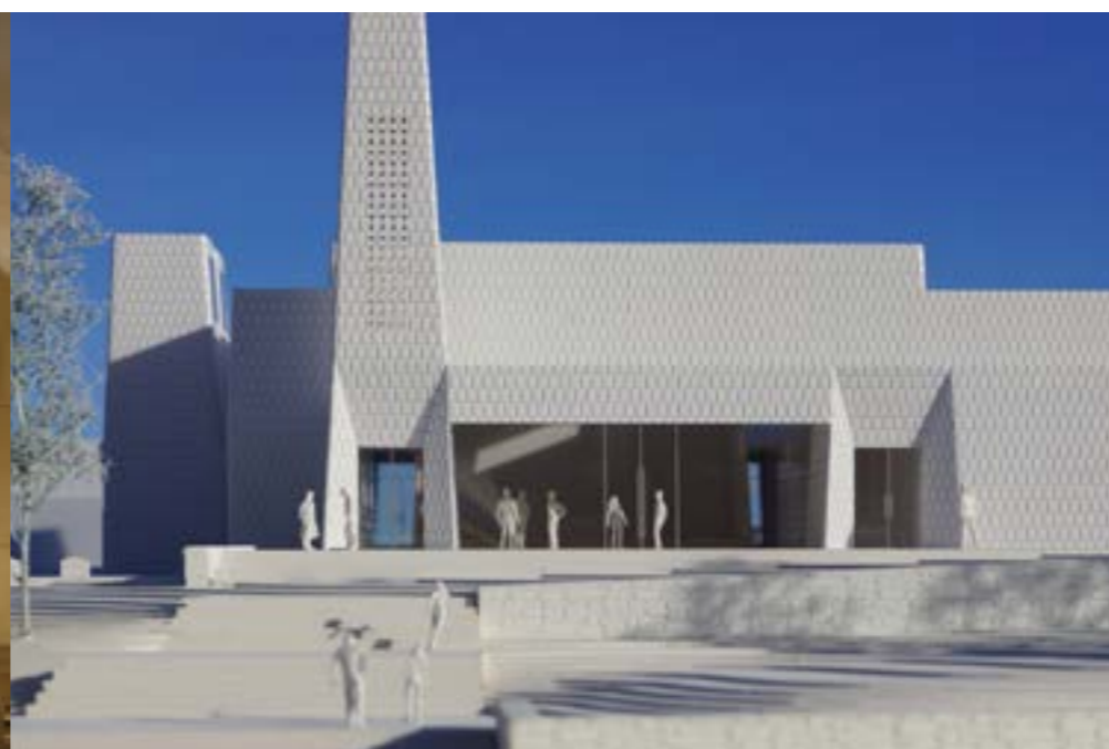
Østre Porsgrunn kirke. Modellbygger Simon Sieger