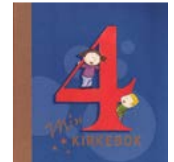
4-årsbok i Vestre Aker 16. september