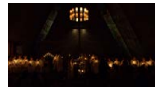
Lysmesse i Bakkehaugen 9. desember