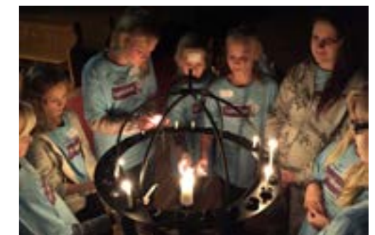
LysVåken i Bakkehaugen 10.-11. november