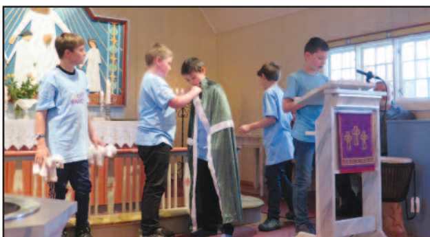
Når sønnen kom hjem, tok faren han imot med en hjertelig klem. Her blir han kledd i den fineste stas, for nå skal det holdes fest!