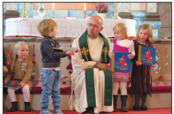
Og selvsagt måtte boka kikkes i med en gang! Der fant fireåringene også historien om sauene som gikk seg vill.

«Min kirkebok 4» ble delt ut til fireåringene sammen med et arbeidshefte de kan bruke hjemme. Etter gudstjenesten var det kirkekafe for alle på Kirkestua.