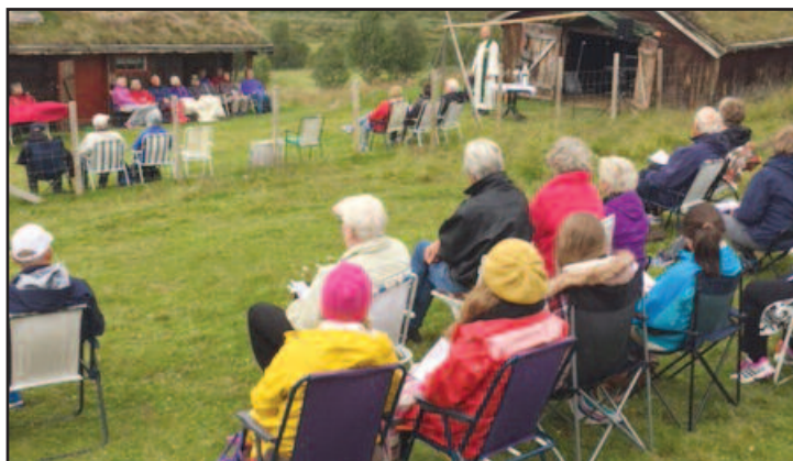
Listuvollen ga en fin ramme om gudstjenesten, og folk hadde heldigvis kledd seg etter været.