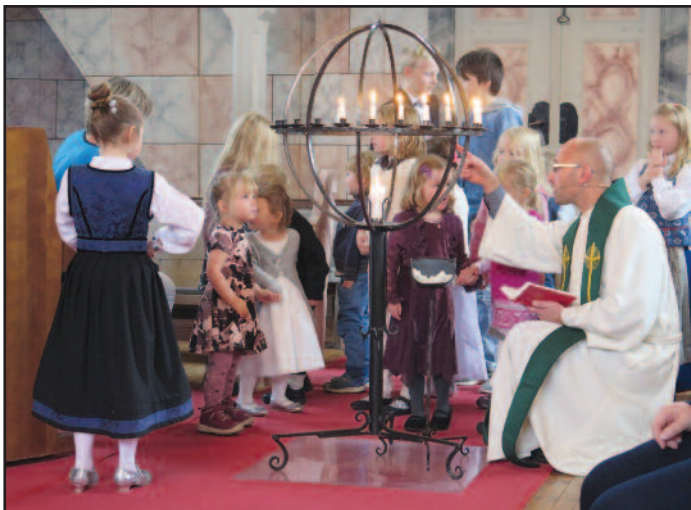
Letingen etter den bortkomne sauene har tatt oss rundt nesten hele kirkerommet, og her er det like før de første barna får øye på den.