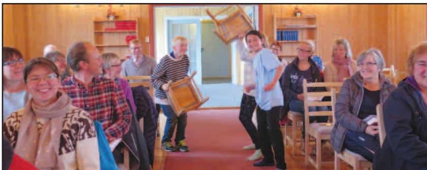
11-åringene dramatiserte fortellingen om den bortkomne sønnen, og lagde skikkelig feststemning når sønnen sløste bort arven sin «i et vilt liv i et land langt borte».

Takk til alle som stilte opp: menighetsråd, trosopplæringsutvalg og konfirmanter! Ikke minst takk til 11-åringene for veldig god innsats!