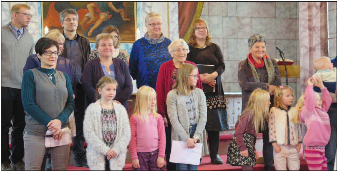
Os familiekor stod for musikken i musikalen, og sang også noen egne sanger senere i gudstjenesten.