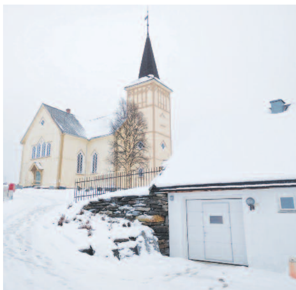
Det nye tekniske rommet er i et tilbygg til bårhuset, skjult bak steinmuren.

Nye satser vedtatt i sak 11/2016. Endringene gjelder fra 1.12.16