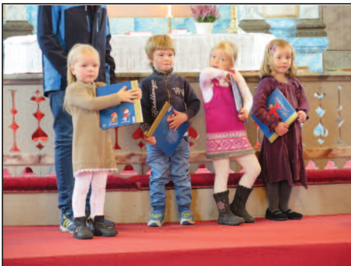
Det er ikke så mange fireåringer i år, men det la ingen demper på gleden over å få fireårsboka.