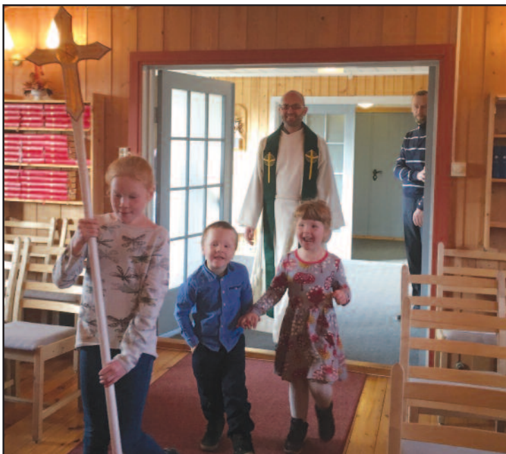
Her var det inngangsprosesjon med et stort smil!