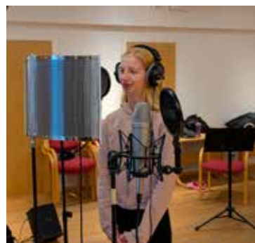
Mari i gang med solo-delen

Etter eit par timar i aksjon, var det klart for pizza. «Utan mat og drikke duger helten ikke». Full av energi etter pausen vart koret delt inn i to grupper som skulle syngje på refrenget. Det var gøy!