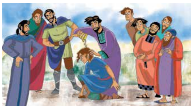
Teikning: Kari Sortland

Samuel hørde mange ting frå Gud. Då Samuel blei vaksen fortalde Gud han kven som skulle bli konge. Kan du finne fem feil på bildet under?