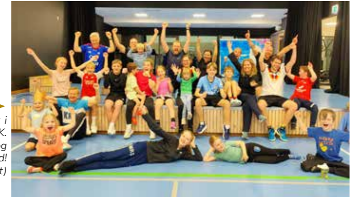
→ Bra med energi att, sjølv etter leik i gymsal med gjengen i FamilieKRIK. Sjekk kalenderen for datoar i vår, og bli med!