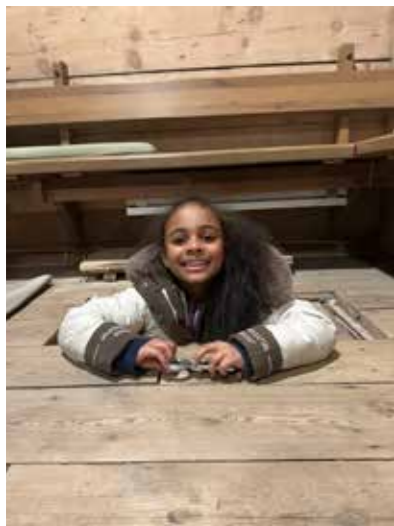
← Ein ekte tårnagent må undersøke nøye for å løyse oppdrag, også under kyrkjegolvet må det gjerast undersøkingar! Støvete, mørkt - og veldig spennande!