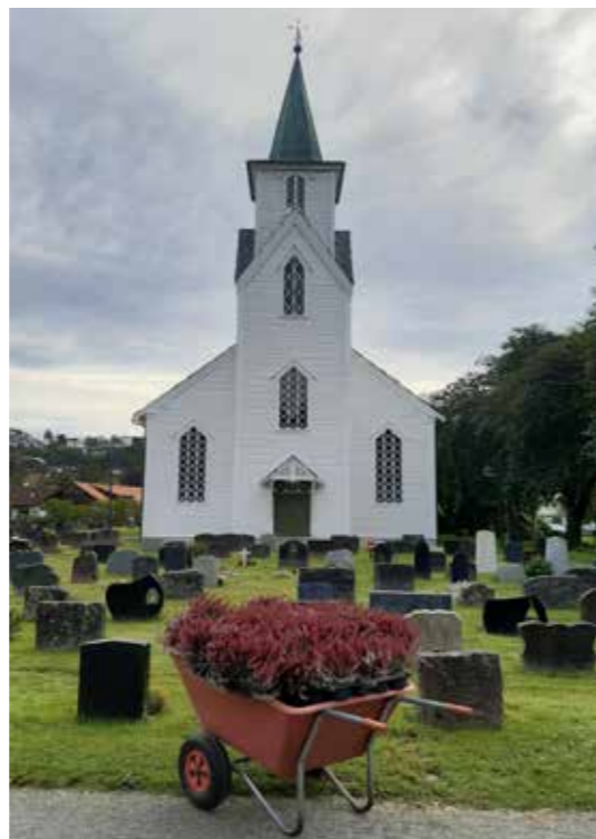
↑ På Os kyrkjegard blir det i år eit prøveprosjekt med robotklipparar levert av Jernia Sælen.

Det vedtekte budsjettet for 2026 er difor svært stramt. Det er innført tilsetningsstopp, og vedlikehald av kyrkjer og gravplassar er kutta ned til eit minimum i år. Vi har vedteke eit budsjett i balanse, men er avhengige av å bruke det som står att på fonda. Fram mot 2027 må vi difor kutte om lag 3 millionar kroner for å sikre ein forsvarleg drift. Det er vanskeleg å sjå for seg at vi kan finne så store kutt utan å måtte vurdere omorganisering og nedbemanning i stabane. Dette gjer at tida framover blir krevjande, særleg for dei tilsette og for sokna.