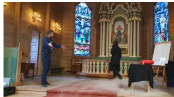
↑ På tårnagent-helg kom det stadig ein mystisk person med nye oppdrag som Tårnagentane måtte løyse for å få tak i - og løyse - ein mystisk kode.