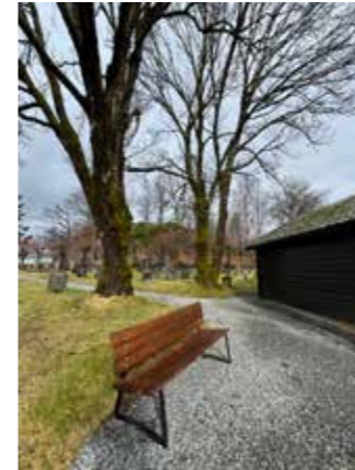
← Nyrestaurerte benker på plass for våren på Os kyrkjegard. Kom og ta deg ein kvil!