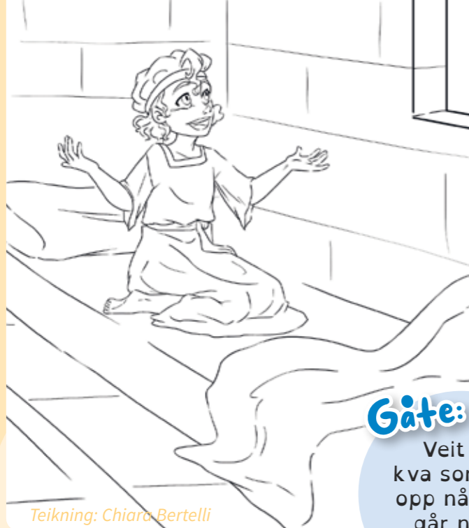
Teikning: Chiara Bertelli

Samuel var ein gut på ca. 6 år som vakna av at Gud snakka til han! Fargelegg bildet av Samuel som vaknar i senga si.