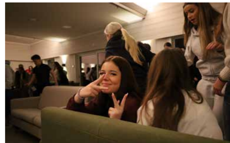
Mathea i godt selskap i sofaen

Tekst og bilete: Gro Helen Blindheim Skjælaaen