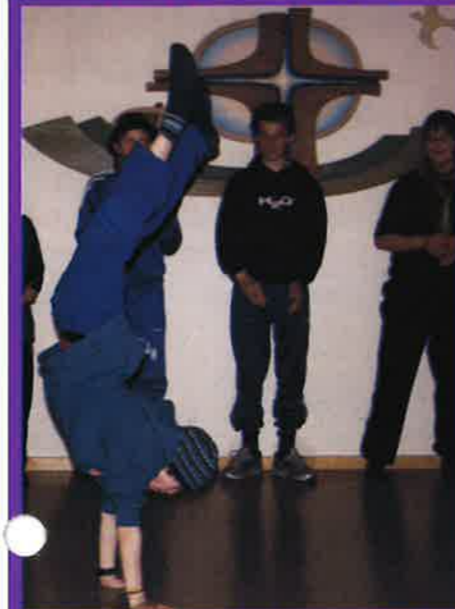
Breakshow på Kaktusfestivalen 2007