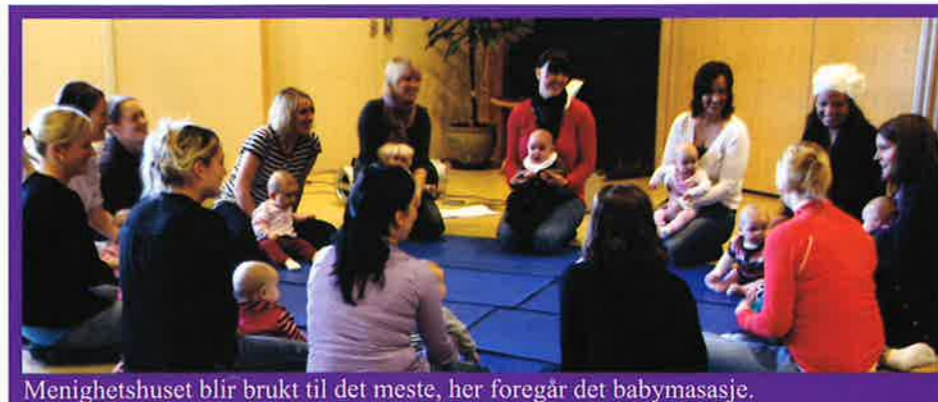
Menighetshuset blir brukt til det meste, her foregår det babymassasje.