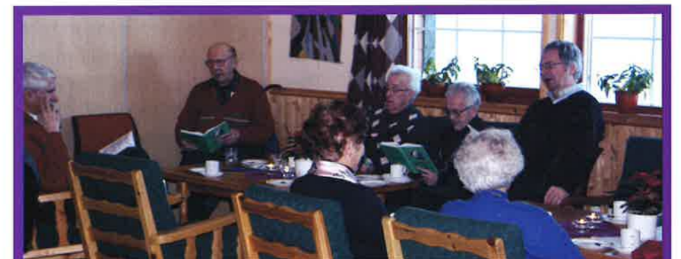
Mandagskaffe samler folk til en trivelig stund.

Drifta går veldig bra. Men det er framleis stor gjeld på huset som må betalast ned. Loppemarked og ba-