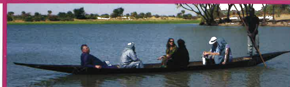
I kano ut på rismarkene. Dette området er knusktørt store deler av året.

er kommet for tidlig. Derfor har landsbyfolket fått hjelp av Kirkens Nødhjelp til å grave noen enkle brønner. I brønnene er det satt ned lange rør som går ned til grunnvannet, 5-6 meter dypt. Disse rørene er plombert det meste av året, da det ikke er nok grunnvann til å dekke vannbehovet i hele vekstsesongen. Men når regntida nærmer seg, går bøndene i landsbyen sammen og leier en pumpe, og pumper opp nok grunnvann til at risene kan såes og vokse seg sterk nok til å tåle flomvannet. En kort periode av året kan de slik gjøre seg nytte av grunnvannet, og nå er det ikke lenger så farlig for dem om flommen kommer tidligere eller senere enn ventet.