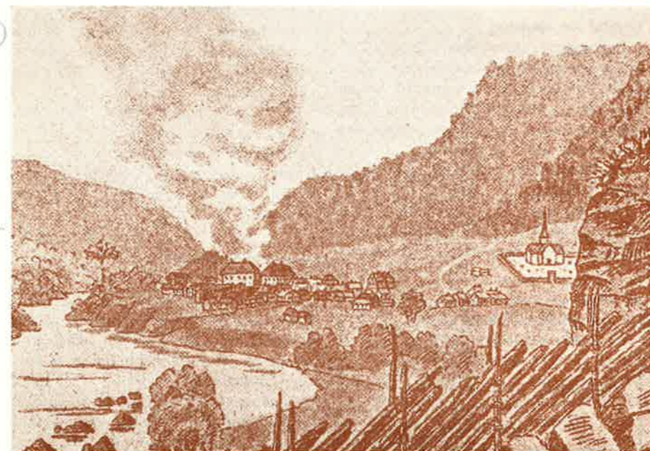
Gammel tegning av Svorkmo hytteplass med Svorkmo kirke.