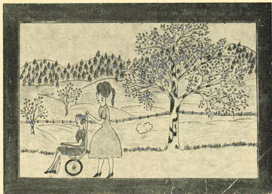
3. pr. 4.—5. kl. Åse Synnøve Larsen, Gjølme skole.

Ennå en gang — takk til alle dere som var med. Hensikten med det hele var at tankene kunne settes i sving: Hva er det vi — og i første rekke jeg — kan gjøre for å følge og fylles av den barmhjertige samaritans sinnelag i vår egen tid og under våre forhold?