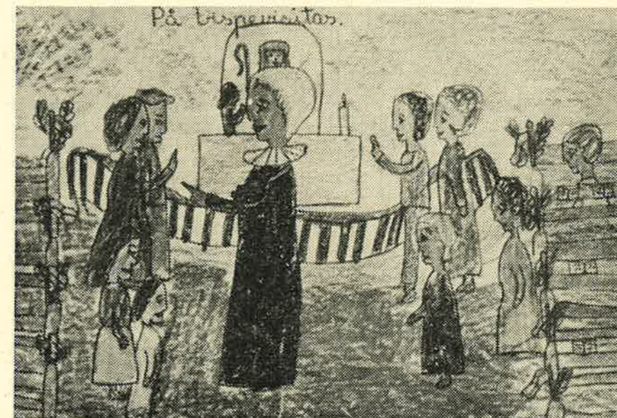
Konkurransen — 2. pr. Oddny Hagen, 3 b, Orkanger