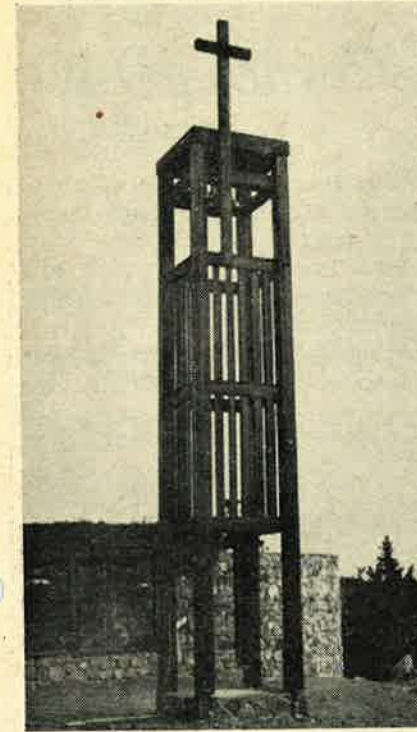
HVOR KORSET STÅR VAKT TAPER MØRKET SIN MAKT

(Under en vårflom i Rena 1910 skrev min mor dette dikt. Hun brukte ofte å frem- si det under okkupasjonsårene. Symbolikken er jo talende nok, og vi tillater oss å gjengi det her i sammenheng med denne måneds mange 20-års min- ner). Red.