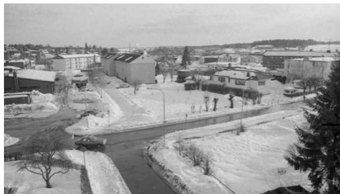
Slik så det fortsatt ut i 1987 på hjørnet av Åsenveien og Sentrumsveien. I Åsenveien 3, eller i Villa Våge, var det begravelsesbyrå helt frem til Jølstad etablerte seg i lokalene i Nordbyveien.