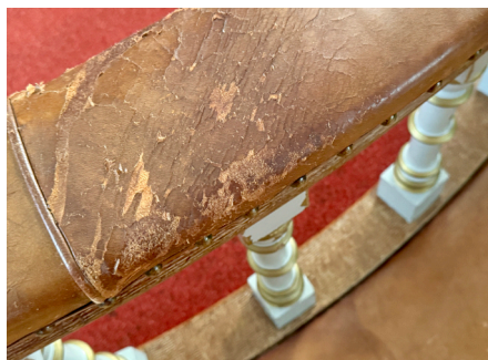
Alterringen i Kråkstad trenger rehabilitering. Fagfolk får det til å skinne igjen.