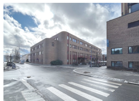
Og slik ser det ut i krysset Åsenveien og Sentrumsveien i dag. Nye forretningsbygg på alle fire hjørner.