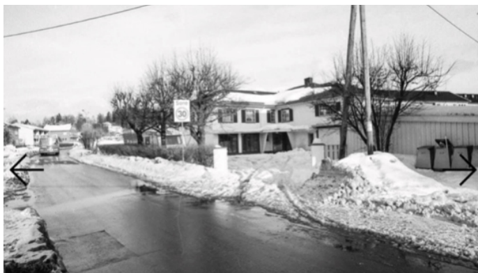
Villa Våge i Åsenveien 3 i 1987. Stedet der Ski begravelsesbyrå eller Chr. Stensruds Eftf. hadde kontor og parkeringsplass for gravferdsbilene, og familien Stensrud og senere Skuterud bodde.