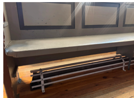
Med bedre varmelegg på plass blir det mindre bruk av strøm til oppvarming.